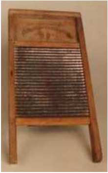
La planche à laver musique ou Washboard

Les musiciens de Country ont évolué avec les modes et ont intégré ou abandonné des instruments en fonction des différents courants musicaux : électrification des guitares, utilisation de la batterie, du saxophone, des claviers.