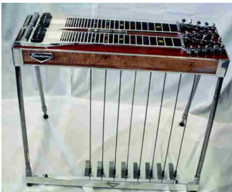
La pedal steel

Cet instrument s'applique traditionnellement aux genres hawaïens, évidemment, "hula" et "hapa-haole", au "country" à l'ancienne (années 1930 et 1940), et au "western swing". Une guitare lap-steel est une guitare "steel" de type hawaïenne dont on joue à plat, instrument posé sur les cuisses ( lap en anglais), et donc dépourvue des "pédales" qu'on trouve sur le type pedal .