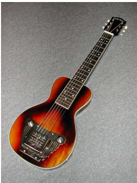
La guitare lap-steel

Les musiciens démunis utilisaient des planches à laver, des cruches, des sifflets et des harmonicas pour jouer du blues, du ragtime et les airs à la mode. Vers 1930, on a perfectionné les techniques pour jouer de la planche à laver et l'instrument a souvent servi à accompagner les chanteurs de blues, et même de jazz. Dans les années 1950, la batterie est devenue plus populaire et a entraîné l'abandon de la planche à laver comme instrument de jazz. Elle a toutefois connu une renaissance dans les groupes de zydeco (la musique des Noirs francophones de la Louisiane et du Texas). Depuis, la planche à laver est devenue un instrument type des musiciens Cajuns, qui se l'accrochent au cou pour jouer de la musique zydeco ou du two-step.