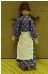
Poupées en tissu