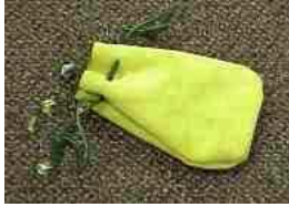
Jeux de billes