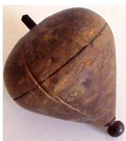
Jeux en bois