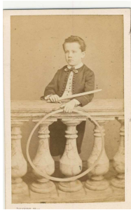
Cerceau et le bâton