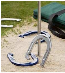
Le fer à cheval